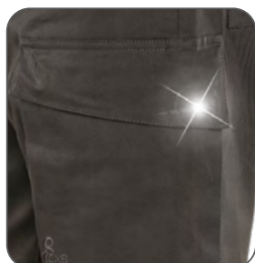
boční kapsa bočné vrecko side pocket boczna kieszeń