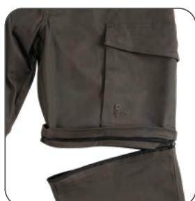
odepínací nohavice - barevné odlišení zipů pravé a levé nohavice odnímateľné nohavice - farebné odlišenie zipsov pravej a ľavej nohavice detachable legs - color differentiation of right and left leg zipper odpinane nogawki - rozróżnienie kolorystyczne zamków prawej i lewej nogawki